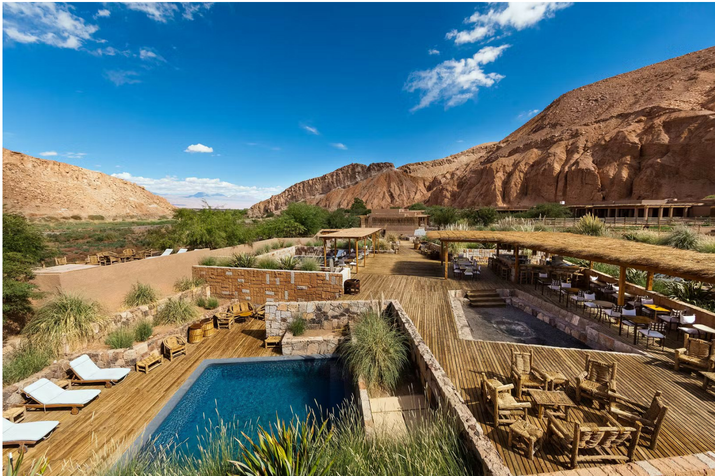
San Pedro de Atacama

Diese komfortable Eco-Lodge bietet ein sehr angenehmes Ambiente und zeigt den Gästen die Einzigartigkeit der Atacama-Wüste und ihren kulturellen Wert.