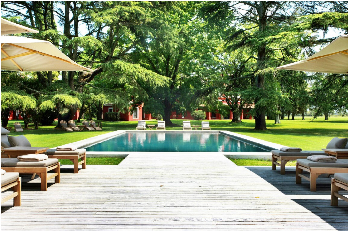
San Antonio de Areco

Die mit Sorgfalt renovierte Estancia La Bamba, im Besitz eines polobegeisterten Franzosen, ist keine aktive Farm, wohl aber ein gediegenes Herrschaftshaus mit Geschichte und Tradition, welches koloniale Eleganz mit Komfort verbindet.